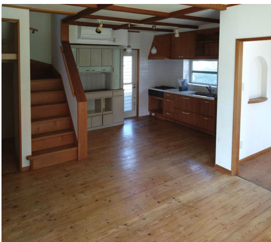
照明・床材・建具等の細かいところまで落ち着いた感じのあるLDKです