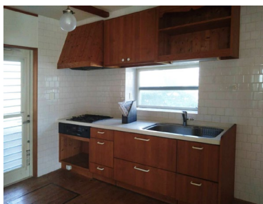
落ち着いた木目調のキッチンです。