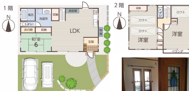
室内の至るところに細やかなデザインが美しく溶け込んでいます。