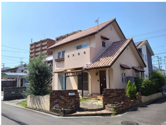
赤茶の瓦屋根にベージュの外壁を組み合わせた南欧風イメージ。

外装や室内、いくつもの箇所に鑄物などが施され、細やかで可愛いデザインが溶け込んでいます。 徒歩5分ほどでフジ垣生店やホームセンター・ダイキ、コンビニ等があり便利です！ また、エミフルMASAKIには、車で10分ほど！小・中学校もすぐ近くにあり、子育てに充実した住環境です。